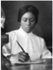
Mary Ann SHADD

Fondateur de la province du Manitoba et chef du peuple métis