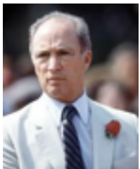
Pierre Elliott TRUDEAU

Un grand activiste de l'environnement et des sciences. Il a reçu le Prix Nobel alternatif en 2009.